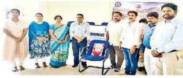
చిత్రపటం వద్ద నివాళులర్పిస్తున్న అధ్యాపకులు